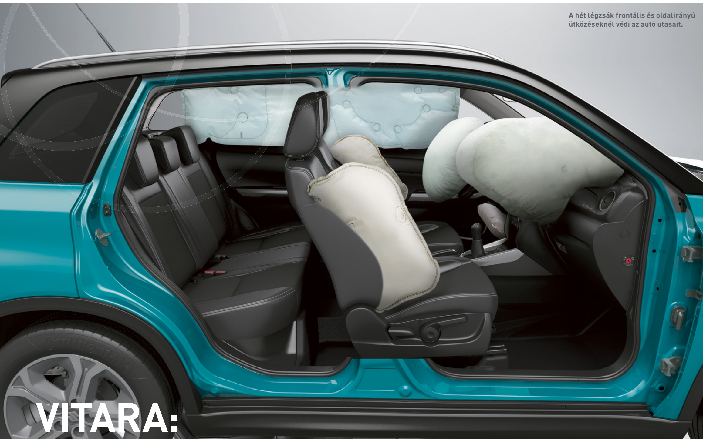
A hét légszák frontális és oldalirányú ütközéseknél védi az autó utasait.