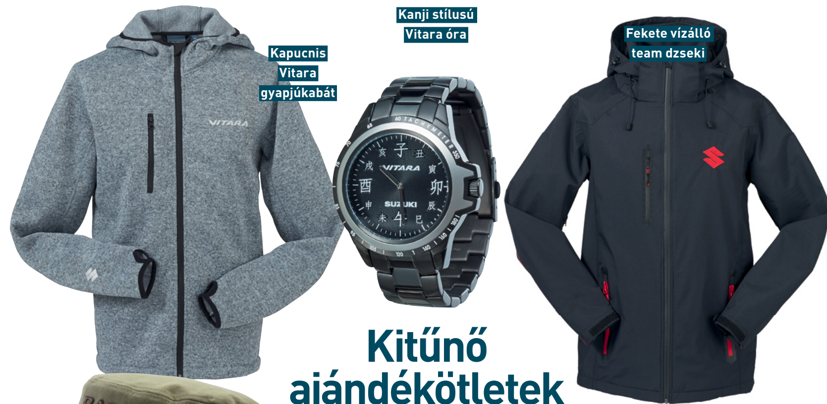
Kapucnis Vitara gyapjúkabát

► A Vitara számos műszaki újítást tartalmaz, melyek növelik a vezetési élmény színvonalát. Az adaptív tempomat, az automatikus vészfék asszisztens és a lejtmenetvezérlő biztonságosabbá teszik a vezetést. Az autó emellett nagy népszerűségnek örvend a testre szabható dizájn miatt is, aminek köszönhetően minden cég a saját arculatának megfelelő külsőt választhat flottaautójának.