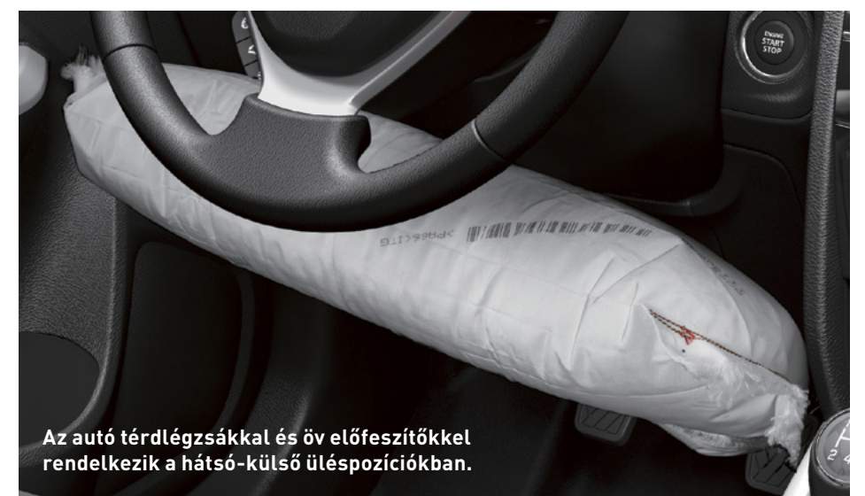
Az autó térdlégszakkal és öv előfeszítővel rendelkezik a hátsó-külső üléspozíciókban.

a vezetőt hang- és műszerfali jelzéssel figyelmezteti. Amennyiben a vezető a figyelmeztetések ellenére sem fékezik, és az ütközés veszélye tovább nő, a rendszer automatikusan aktiválja a fékasszisztenszt a baleset megelőzése illetve a károk mérséklésének érdekében. Mindezekon kívül az új Vitara a Suzuki első európai modellje, amelyet lejtmenetvezérlővel láttak el. A jármű a LOCK üzemmódban automatikusan fékezik, amikor meredek lejtőn állandó sebességgel halad lefelé. Az Euro NCAP tesztek jól tükrözik, hogy egy autó hogyan teljesít balesetveszélyben, de a csillagok számát az is befolyásolja, hogy milyen biztonsági berendezéseket kínál a gyártó a különböző piacokon. A Vitara esetében az öt csillag nemcsak azt jelenti, hogy az autó kiemelkedően biztonságos, hanem azt is, hogy ezek a biztonsági berendezések elérhetőek a modellekben Európa egész területén.