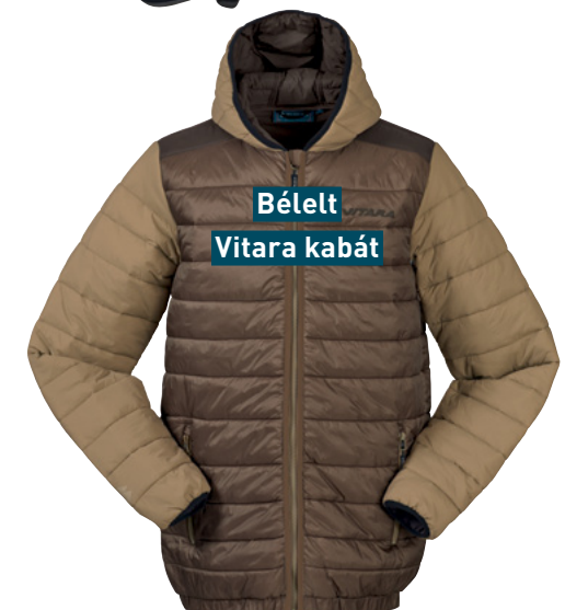
Bélelt Vitara kabát