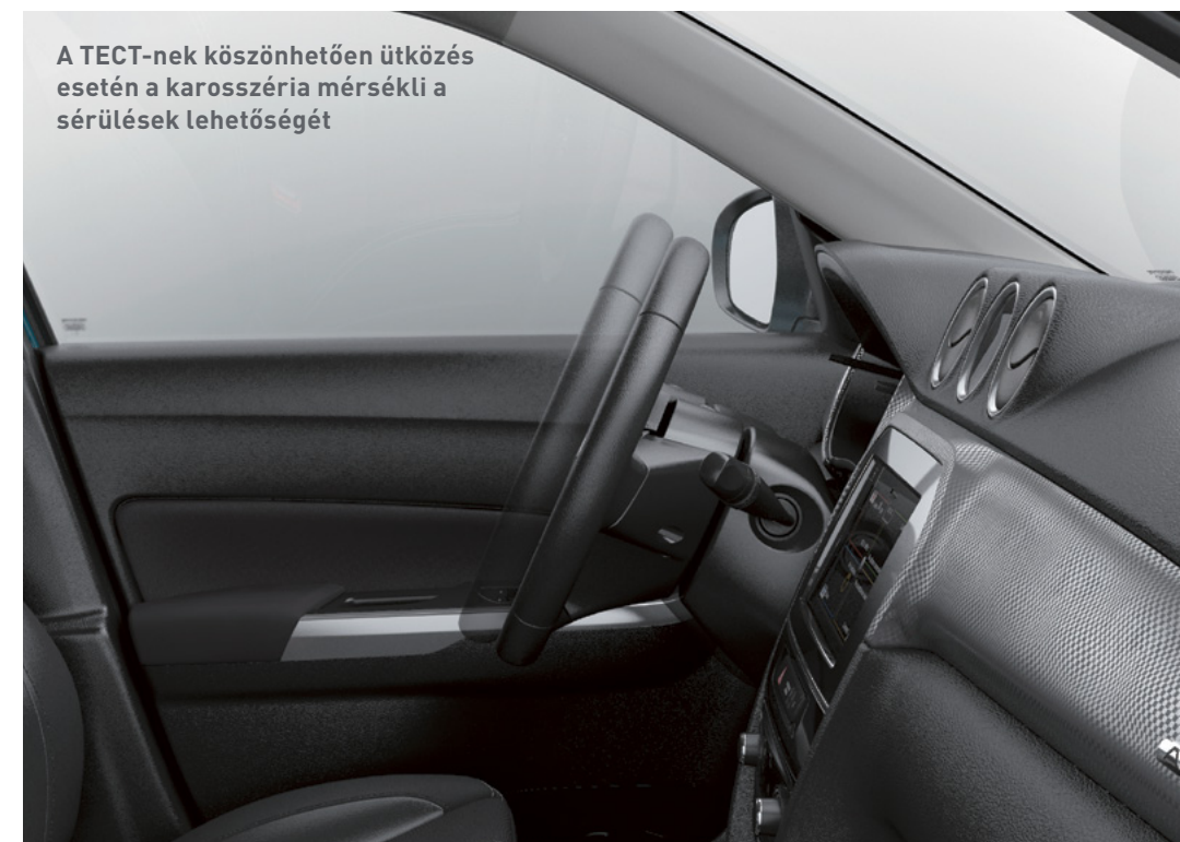
A TECT-nek köszönhetően ütközés esetén a karosszéria mérsékli a sérülések lehetőségét