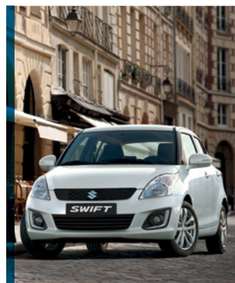
Swift, Swift Sport

Az ügyfél igényeitől függően különböző modelleket javasolunk flottaautónak. Az SX4 S-Cross előnye az ALLGRIP illetve a bővíthető csomagter, a Swift pedig egy megbízható, 5*-os töréstartással rendelkező városi kisautó. Terepre a legextrémebb utakon és időjárási körülmények között is megbízható Suzuki Jimnyt ajánljuk, a Vitara pedig a legújabb, adaptív tempomattal, automatikus vészfék asszisztenssel és a lejtmenetvezérlővel ellátott városi terepjáró. Az év folyamán várhatóan még egy modellel, a Celerioval bővül majd a Suzuki flottakínálata, mely 254 literes belső csomagterével és háromhengeres eco benzínmotorjával várja majd a vásárlókat.